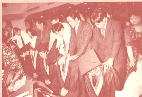
眾教會牧師同來為應屆畢業生差遣按手禱告