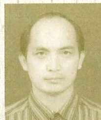
1. 白重生 九曲堂更新教會