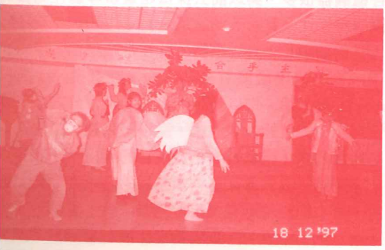
年級同學以表演方式, 道出神以六天來創造宇宙萬物, 真是唯善唯美的演出。