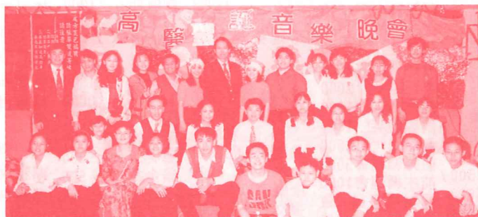
本院學生在高雄醫學院陪伴重症兒童及家屬歡渡聖誕音樂晚會藉此將福音廣傳。