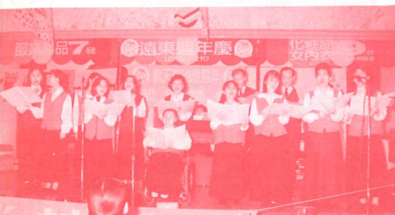
本院宣教團契學生歡唱救主耶穌降生