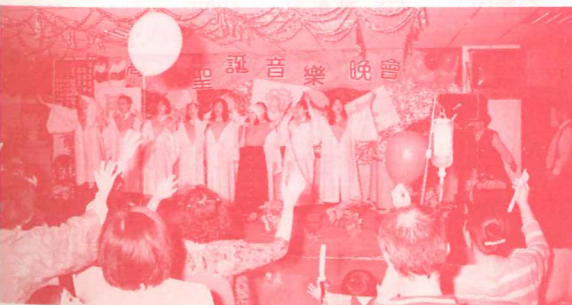
聖光見證隊學生帶動讚美敬拜