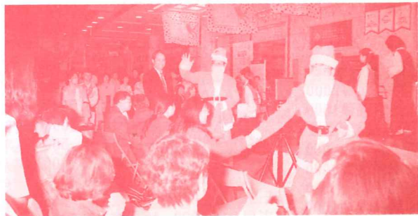
由學生裝扮聖誕老公公將禮物分送給參加者及路人，以添聖誕氣氛。