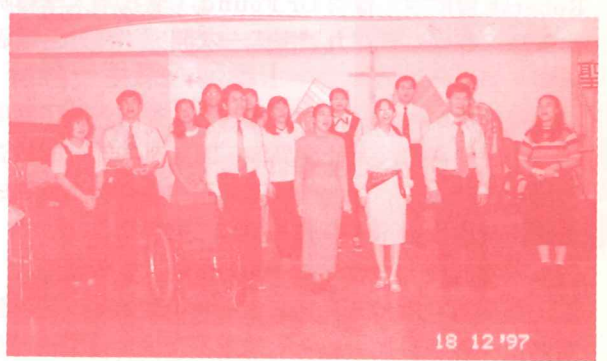
本屆畢業班同學唱作俱佳。