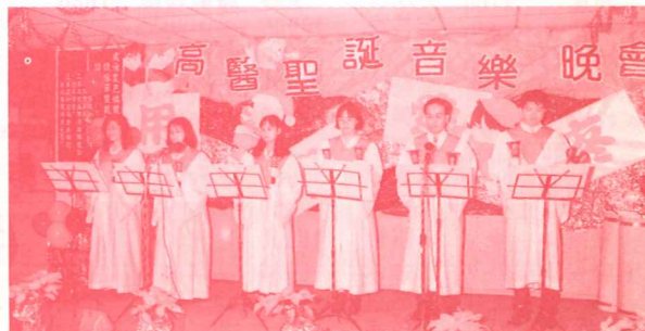
聖光見證隊同學手鐘表演「神真美好」