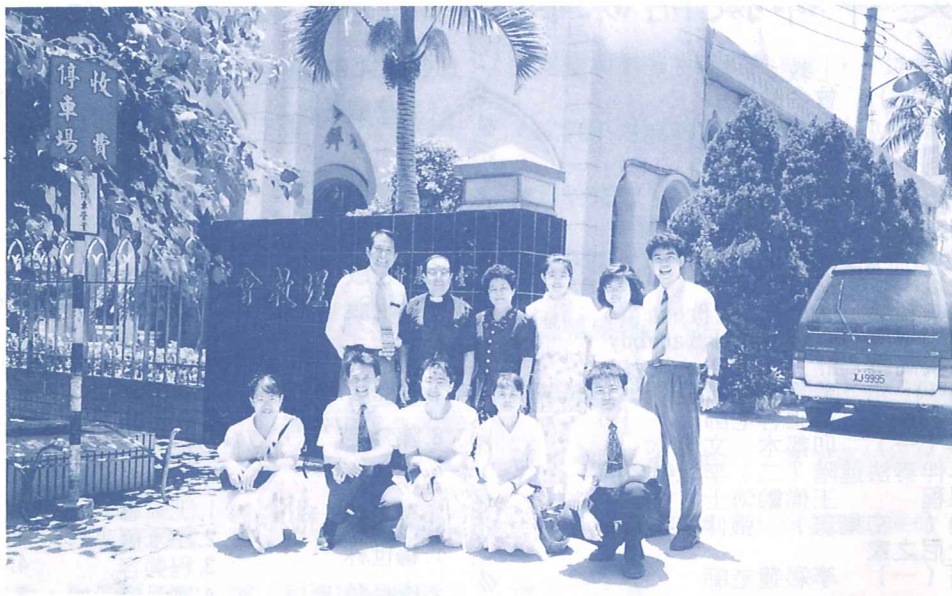
於鹽埕長老教會與戴牧師師母合影

希望在服事的道路上，彼此扶持勸勉，因為祂是配得我們一生來敬拜頌揚的萬王之王、萬主之主——耶穌基督！（聖樂三盧信娟代撰）