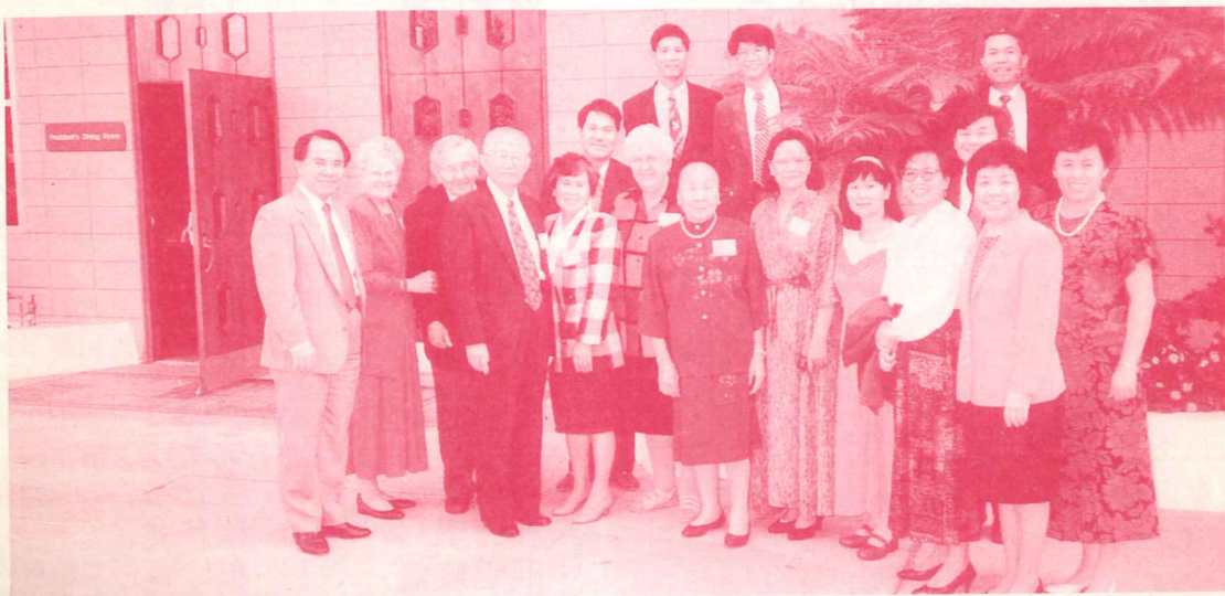
1995年10月30日與阿殊沙太平洋大學締結姊妹校，本院方面的代表合影(院長、主任、校友、儲備師資、聖光之友……等)

■非常謝謝教會牧者幹事、弟兄姊妹的協助，無論更改教會機構份數、地址、電話個人資料異動等，提供我們最新最正確資訊，您小小動作關係資源節約；因此，每當接到電話、信件或傳真告知時，同工心存感恩，也期盼您繼續協助，減少院訊及郵資浪費，共同珍惜每一分奉獻，使每一份院訊都確實送達期待她的讀者手中。