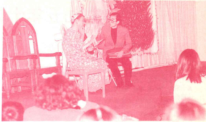
二年級師生演出「另一種自由」反串製造笑果

■學生放聖誕新年假期間，學院特為教職員舉辦一日退修會，12月29日教職員眷屬合計23名，分乘四輛自用車遊墾丁，體會風吹沙、漫步社頂公園、欣賞關山日落，享受福音中心校友的愛心午筵，大快朵頤東港海產；慶祝總機姐妹結婚21週年，家屬間彼此相交相顧，充份流露主內一家的溫馨美好。