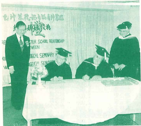
聖光、西方兩神學院締結姊妹校