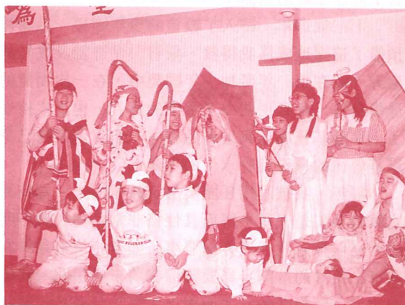
• 聖誕晚會兒童演出「耶穌降生」劇