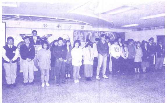
▼我在這裡，請差遣我