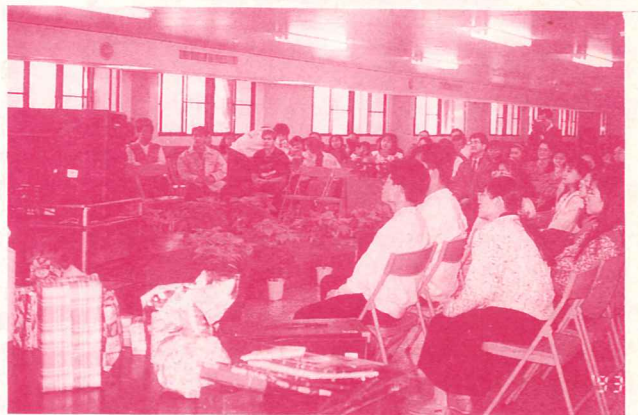
聖詩卡拉OK比賽會場