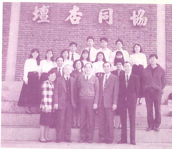
• 聖光見證隊與協同中學陳校長合影

覺得非常省力又省錢。試想，一般要舉辦三千多人參加的佈道會，動員的人力不算，光是經費非得花上幾十萬元是辦不成的。求主施恩給基督教大學、中學、小學，甚至幼稚園。要好好捉住現成的傳福音機會，得著今天的青少年學生，明天教會復興就有希望。