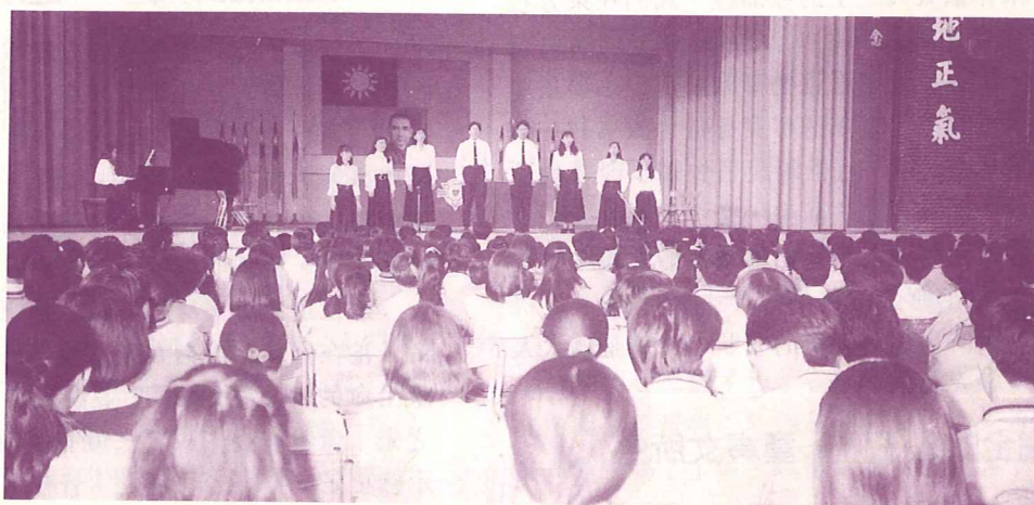
• 見證隊在協同中學獻詩佈道盛況