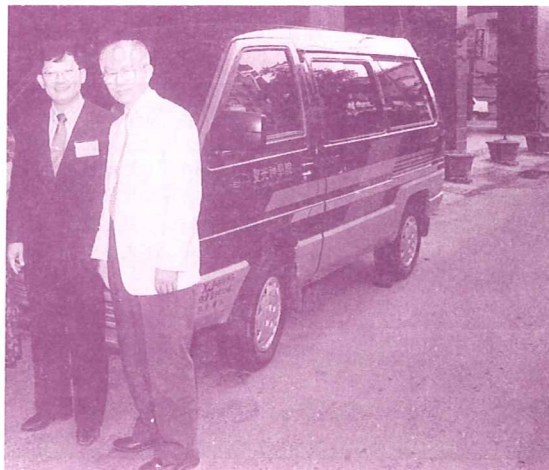
▲院長、校友會長與嶄新的福音車合影

▲為保持學院的綠意,我們急需對園藝有興趣對花草有愛心的家庭主婦或退休弟兄姊妹,每週一天來幫助我們照顧花圃盆栽。有負擔的兄弟請與行政處聯絡,謝謝您的投入。 電話:07-2519203轉107