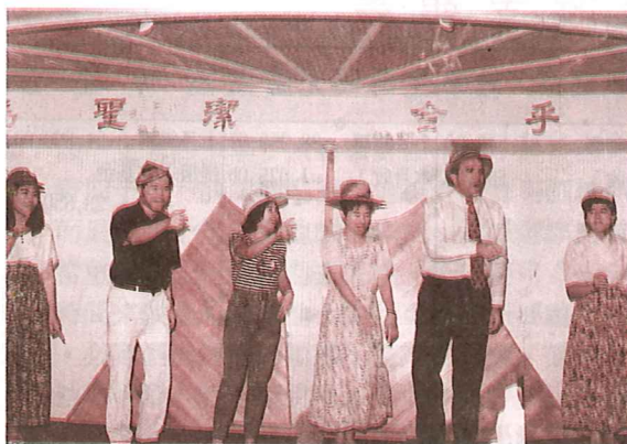
聖樂晚會老師們的「即興樂」演出