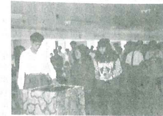
參加獻身會，獻身事主。