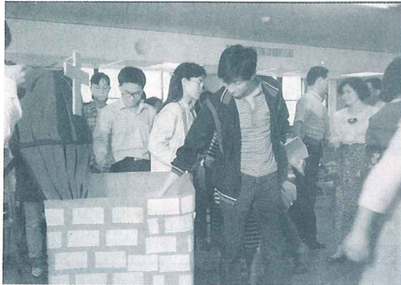
▲三二九青年獻身研討會

(本刊訊) 第九屆青年獻身研討會，已於三月廿九日下午四時半圓滿結束。此次參加的學員共有九十八位，其中卅六位決志願全職事奉，六十二位願一生為主而活。