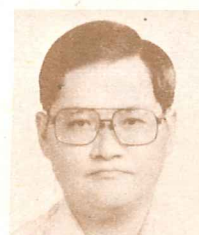
高雄黃克西 福音禮拜堂