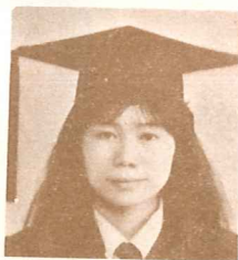
台中柯瓊美 榮中禮拜堂