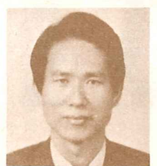
鳳山莊丁金 南京浸宣會傳道