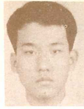
李長榮 左營國語禮拜堂