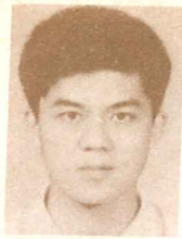
高雄陶其榮 三光循理會傳道