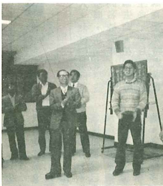
▲ 歡送羅師傅 ▲

新校舍開支大增 請在主前代禱 多年來聖光師生日夜祈禱紀念的重 建校舍工程，今已全部完工，巍峨堂 皇的新校舍呈現在每一位聖光人眼前 ，除了滿懷感恩分享這 份喜悅與榮耀，更要感 謝每一位愛主的聖光之 友，您用禱告與奉獻來 支持聖建。 隨著新大樓的竣工， 龐大的維護與設備費也 隨之俱增。到目前為止 ，經常費已透支十三萬 元，聖建款項也透支約 九百九十五萬元(含借 款一千萬元)，到月底 尚需付聖建支票款一百六十七萬元， 設備款三百一十八萬元。懇請眾弟兄 姊妹繼續代禱與支持。