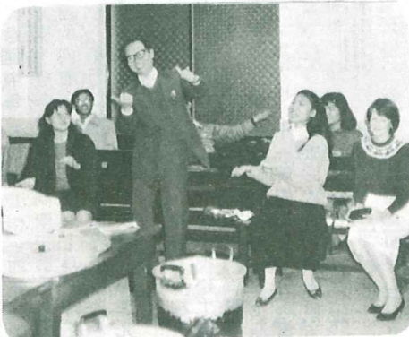
▲本院大家長的精采表演