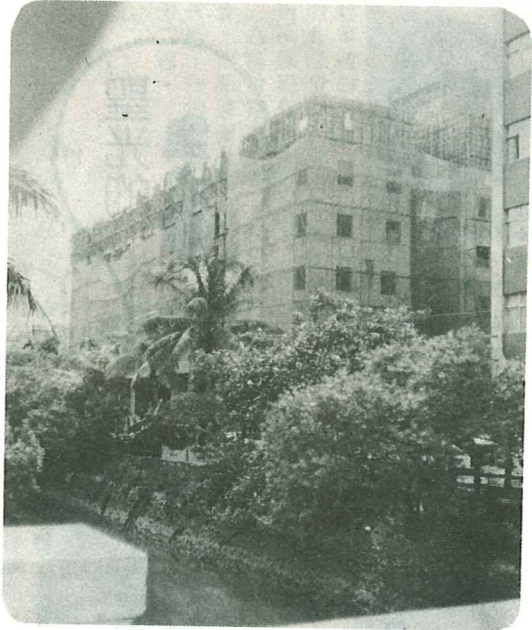
聖光校舍最近施工情形