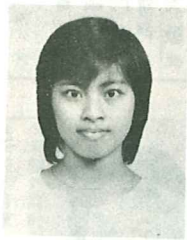
白梅香 中間路教會 教育科