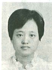
黃珍 香港門諾會 教育科