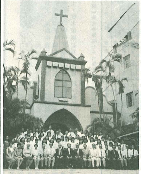
禮典學開屆三卅第院學神光聖 ▲

他手中作壞了，他又用這泥另作別的器皿，窑匠看怎樣好就怎樣作。」耶十八：4。保羅也說：「窑匠難道沒有權柄從一團泥裏拿一塊作貴重的器皿，又拿一塊作成卑賤的器皿麼？」羅九：21。 三、器皿是被主人使用的，不能自我主張，主人用他做什麼就是什麼，將它安置在那裏就在那裏，主權完全屬於主人，器皿是完全順服的。 神不是選用人才，乃是揀選器皿，因為神要的是器皿，一個完全潔淨順服將主權全交托主人的器皿，所以神的工人都要成爲合用的器皿；神學院是神用來製造器皿與培養器皿質素的地方，成器的就被重用，因為神要用貴重的器皿，這就是聖光以提後二章廿一節爲校訓的原因：「人若自潔，脫離卑賤的事，就必作貴重的器皿，成爲聖潔，合乎主用，預備行各樣的善事。」