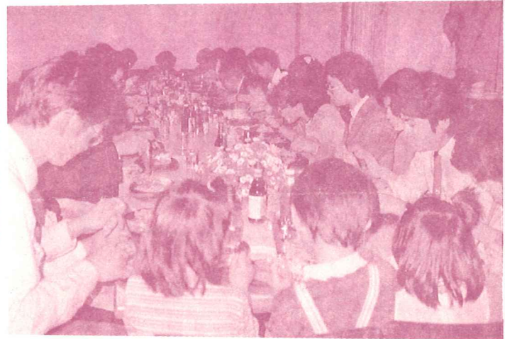
台中區聯誼會共享午餐