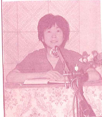
兼工、同責、負製、節 年三、姊妹、玲、機 光、業、光、控 前