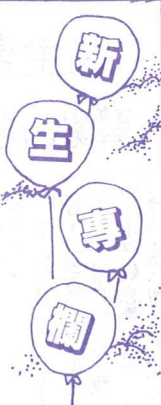
新生背景資料圖表：