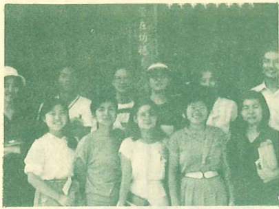
宣教小組合影於北港朝天宮前

編者案：宣教小組係由聖光神學院有心參與宣教事工之學生所組成，利用每週一次的聚會了解各國宣道事工並為之代禱，為了更實際體會些宣道滋味，曾於今年寒假前往高雄縣三民鄉三地教會佈道，暑假期間宣教小組選定台灣偶像最多的地區——北港，再次出征。