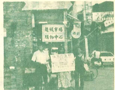
沿街發海報，邀請參加佈道會

聖光幸幸學子一行十五人，任重而道遠的前往北港宣揚福音，為要尋得那未著之地，大伙兒和當地北港教會——天恩堂的青年，頂著又大又圓的日頭，走遍大街小巷，散發單張，進入廟宇，傳講真理，雖然我們的身子疲憊不堪，原本白皙的皮膚也因強烈的金光照射下漸轉變成古銅的膚色，但我們的心是熾熱的，我們的靈是歡喜的，只因神的愛在我們心際間匯成一股巨大的洪流，直奔湧向那些生活在黝黑、痛苦、絕望的人心裏。