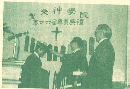
第二十六屆畢業典禮