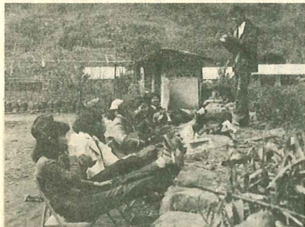
宣教小組步行達民生村，路邊小歇

去年九月學校開了一門有關宣教的課程，激起不少同學對宣教工作的負擔，這些同學爲了對宣教的準備和工場的認識有更深的了解，故組成「宣教小組」由聖光老師芮寶芝教士任顧問，藉每週五的小組聚會，爲世界各地宣教工作代禱，並傳遞宣教異象。寒假時間宣教小組聆聽吳異文化之雄辯三民鄉民權利山地教會，參與佈道與社區訪問的工作，出發前一個月展開積極籌備並於最後一週緊鑼密鼓的排練獻詩、演劇、採購，當一切就緒，即依期出發，不料風塵僕僕的進入山區抵達關卡時，卻因三位同學入山證手續未辦妥，被拒於外，因計劃已定須如期完成，只得留他們於關卡外，其餘十位同學先入山，再想辦法解決。到達民權村後，發覺某專科學校學生正展開與我們同期的社區服務，大伙兒的心頓時冷了半截，層層的考驗似乎在提醒我們打屬靈的仗，非得依靠神不可，於是放下手中的行李和預計展開的籌備工作，先回到主面前卸下掛慮，專心求告祂的名，讚美祂，向祂但誇勝。感謝主！一個下午的禱告仰望，不僅爲這四天的工作預備好自己的心，也看見天父的恩典臨到：先是三位同學平安歸隊，後是這些專科學校的學生願放棄他們的計劃參與我們的工作。 第二、三天我們分別在民權村，及步行約兩小時行程的民生村探訪、佈道，藉着詩歌、見證、短講、短劇（母淚滴滴情）將福音帶給這些傳統的山地基督徒，每次的聚會往往信徒還沒有受感動，我們都先被感動了，站在台前眼見飢餓的群眾，令我們想到人，以後也得面對許多需要自己牧養的羊，這一幕對我們是一個提醒——你給他們什麼？感謝主，這個看見是一個額外的收穫。 四天下來的奔跑，同學們體力雖消耗不少，仍不帶倦色，大伙兒都覺得平常埋首書堆中的神學生，趁假日有如此學習機會是好的，於是下山時一致通過「我們還要再出發」。