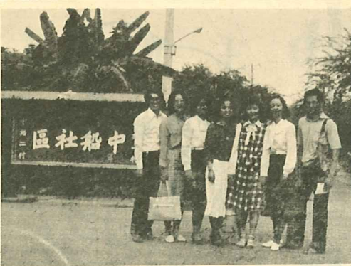
右圖：福音隊整裝待發

七十一學年度上學期，一年級學生分別參予鼓山福音會及小港信義會的工作，不僅幫助教會開始佈道