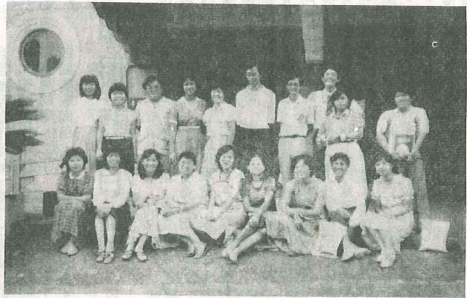
聖光同學參加青宣會合照