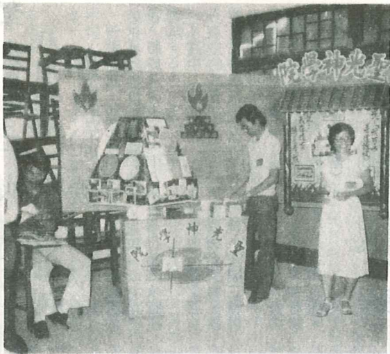
第二屆青宣會聖光神學院攤位

神在海外各地已經預備了四千七百間華人教會，因此華人教會漸漸走向日不落教會的目標，此乃宣教的跳板。此次大會中願全職事奉的青年約有七百二十四位，確信未來的廿年將是華人基督徒普世宣教事工，巴不得我們都預備妥，可以投入神的計劃中。