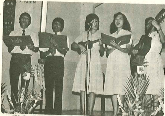
Witnessing Team 見證隊獻詩