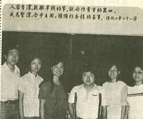
Newly-elected student body officers 學生會新同工

人若自潔，脫離卑賤的事，就必作貴重的器皿。成為聖潔，合乎主用，預備行各樣的善事。提後二章二十一節