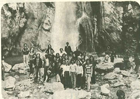
We hiked to the waterfall at the retreat 谷關瀑布前合影