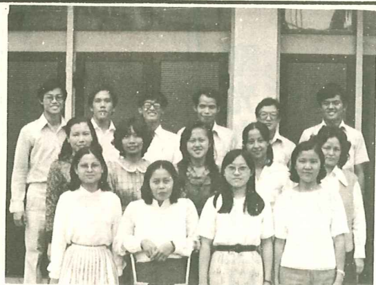
片照生新級年一光聖

信徒的肺腑之言。這次去信我們理想能否實現？我們是有決心等待的。我們要求能夠得到三本新舊約全書和一部經課講義。特請先生煩神設法給我們辦到，我們全體信徒打心眼裏感謝您！恩公發出慈愛可憐我吧！」